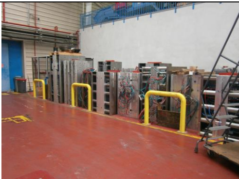
Une partie des différents moules servant à la fabrication des jouets